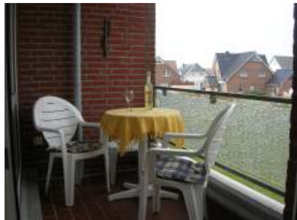
Balkon mit Gartenmöbeln

Die Wohnung ist ganzjährig zu mieten. Wir freuen uns auf Ihren Besuch.