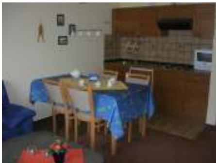
Küchenzeile mit Essplatz