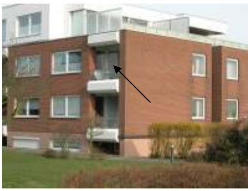
Wohnung 321 Haus Vogelsand